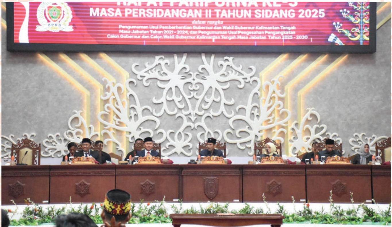
DPRD Kalteng menggelar Rapat Paripurna Penetapan Gubernur dan Wagub Terpilih di Kompleks Gedung Dewan.