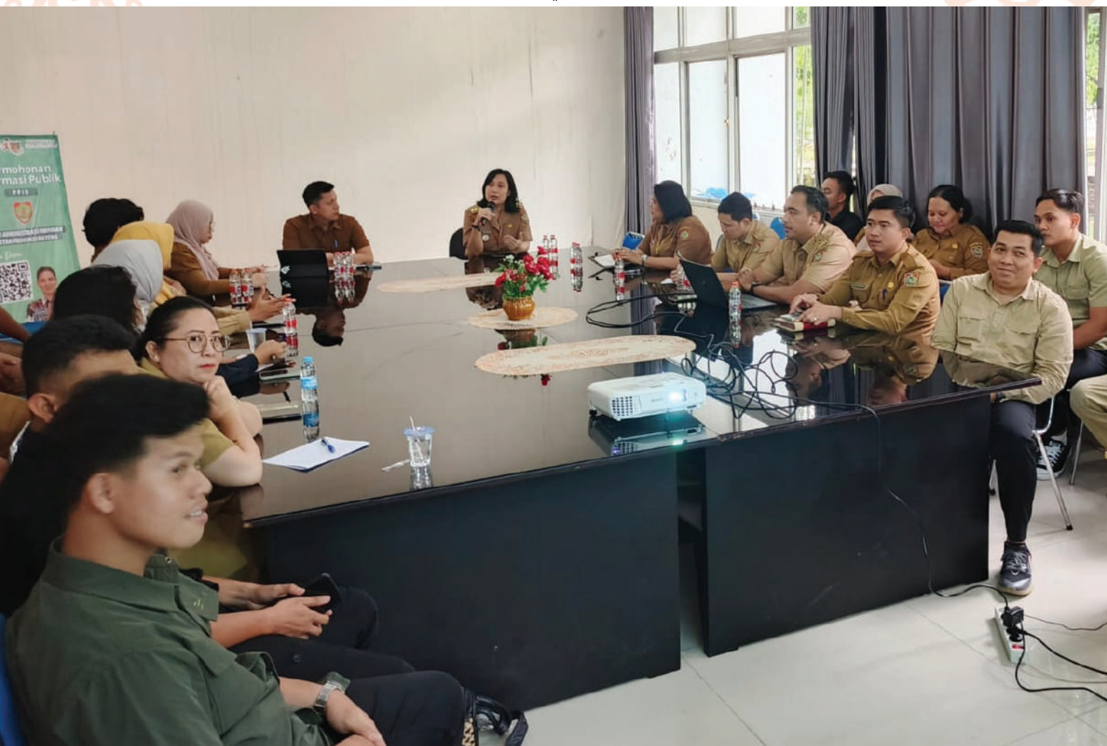
Biro Adpim Setda Provinsi Kalteng bersama BKD Provinsi Kalteng menggelar kegiatan Pemantauan dan Pembinaan Implementasi Sistem e-Kinerja dan Aplikasi Sinerja di Ruang Rapat Biro Adpim.

Pada kesempatan ini juga dipaparkan raihan implementasi e-Kinerja di lingkungan Biro Adpim serta dibuka sesi tanya jawab sejumlah kendala yang dihadapi para pegawai. (dew/bow).