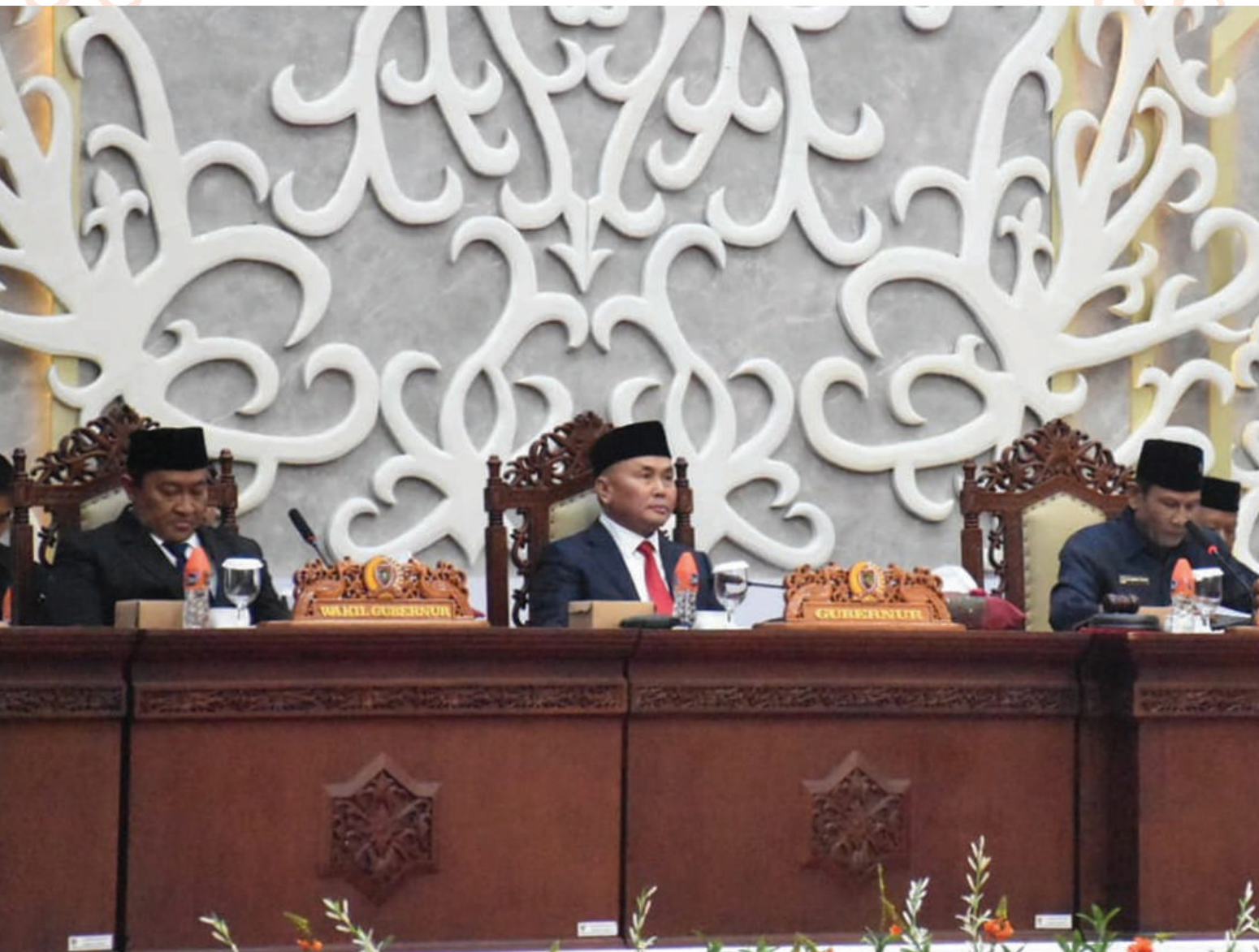
Gubernur Sugianto Sabran menghadiri Rapat Paripurna Ke-3 Masa Persidangan II Tahun Sidang 2025 di Kompleks Gedung DPRD Provinsi Kalteng.

“Kalteng itu butuh rumah sakit yang memadai, kita sudah koordinasi juga dengan Gubernur dan Wakil Gubernur Terpilih,” tandasnya. (ira/eka).