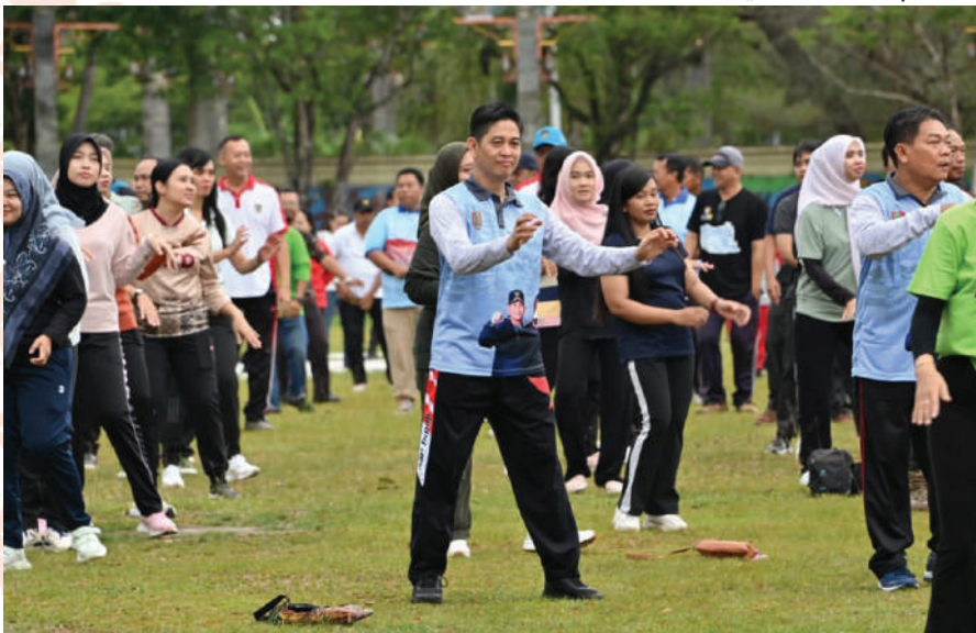
Pemprov Kalteng menggelar Senam Pagi Bersama di Halaman Kantor Gubernur.

Selesai senam, acara pun semakin berlangsung hangat dan meriah dengan pengundian berbagai doorprize, mulai dari paket Sembako, TV, kulkas, hingga paket Umroh dan wisata rohani bagi para pegawai yang beruntung. (set/fen).