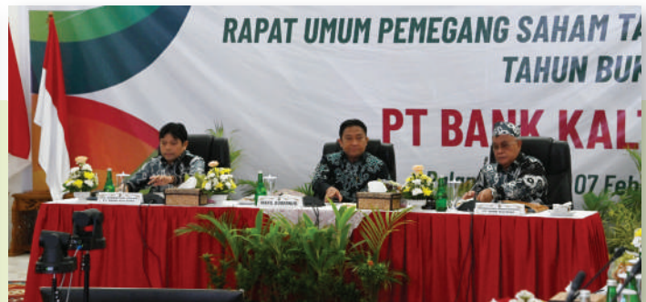
Wakil Gubernur (Wagub) Edy Pratowo hadir secara langsung Rapat Umum Pemegang Saham (RUPS) Tahunan Tahun Buku 2024 yang digelar oleh PT Bank Pembangunan Daerah Kalimantan Tengah (PT Bank Kalteng) di Istana Isen Mulang, Palangka Raya, Jumat (7/2/2025).